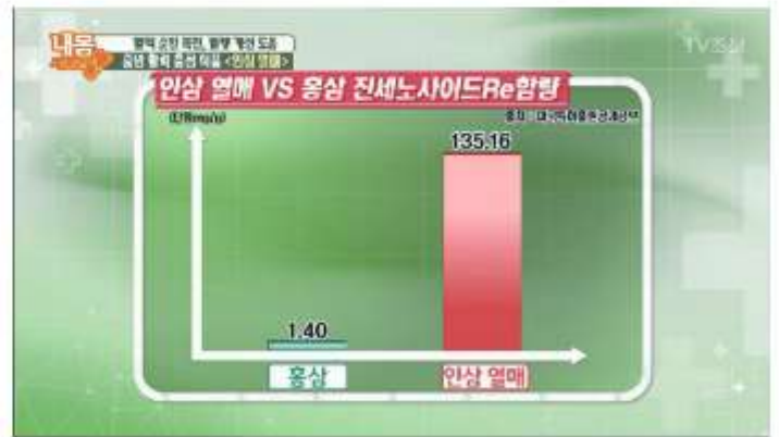
홍삼 VS 인삼열매