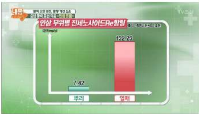
인삼뿌리 VS 인삼열매