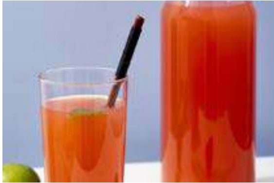
Kayseri Gilaburu Suyu