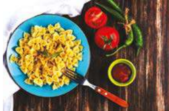
Kayseri El Yapımı Makarna