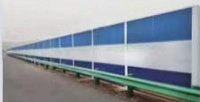
池州“杏花村”公路声屏障