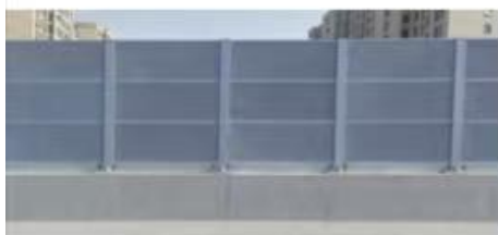
“杭颖路大桥”声屏障