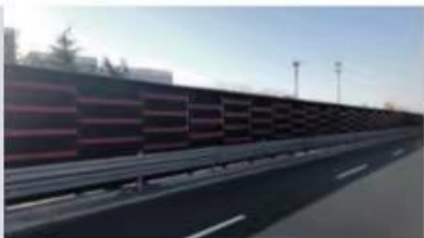
山东淄博服务区声屏障