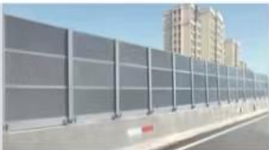
阜阳市政道路声屏障